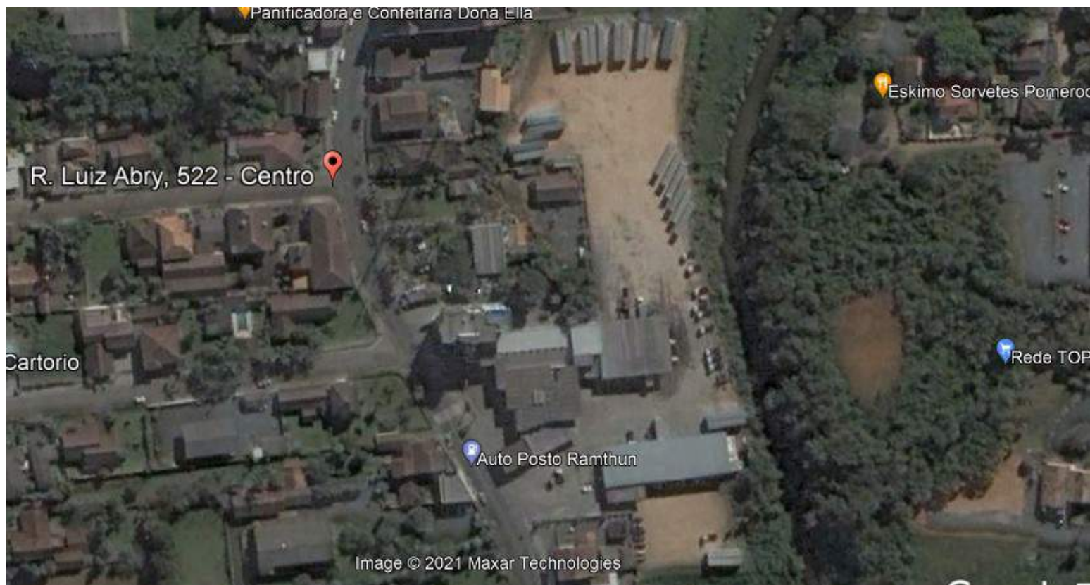
Foto aérea de julho de 2005, quando não existia a RUA ARTHUR REINERT e os fundos da RUA LUIZ ABRY, 522, POMERODE – SC, tinha comunicação com os fundos do AUTO POSTO RAMTHUN, no nº 422 do mesmo logradouro