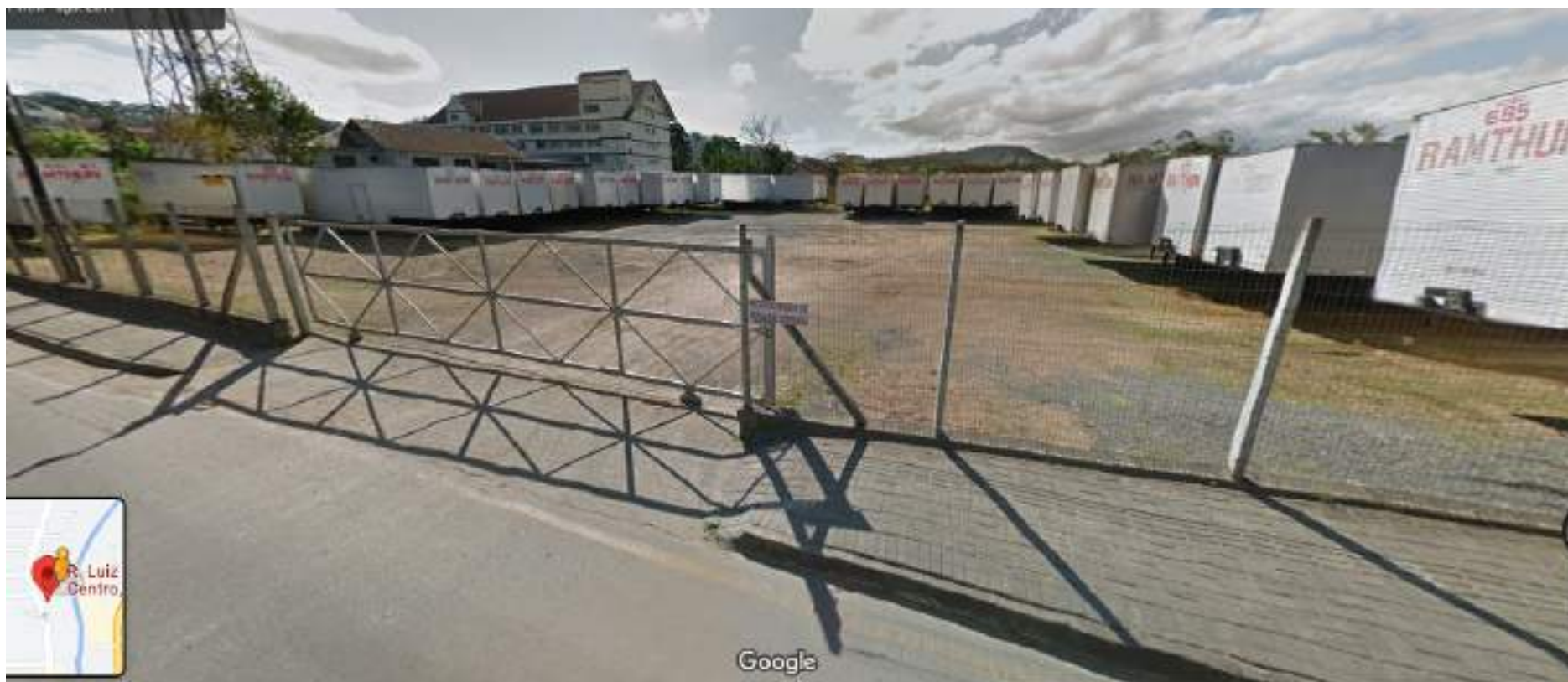
RUA ARTHUR REINERT fundos da RUA LUIZ ABRY, 522, CENTRO, POMERODE - SC (fundos da M2LOG S/A LOGISTICA E TRANSPORTES e da empresa RAMTHUN - COMERCIO E LOCACAO DE BENS )