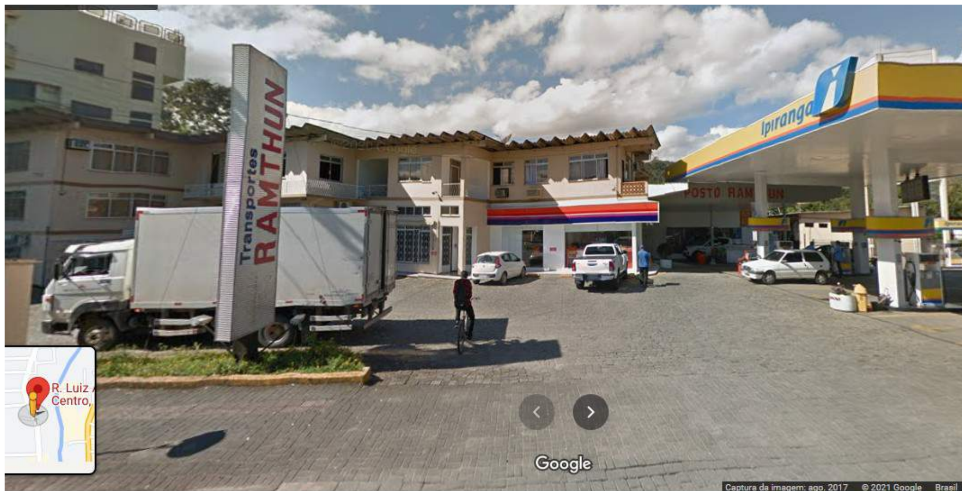
RUA LUIZ ABRY, 422, CENTRO, POMERODE - SC