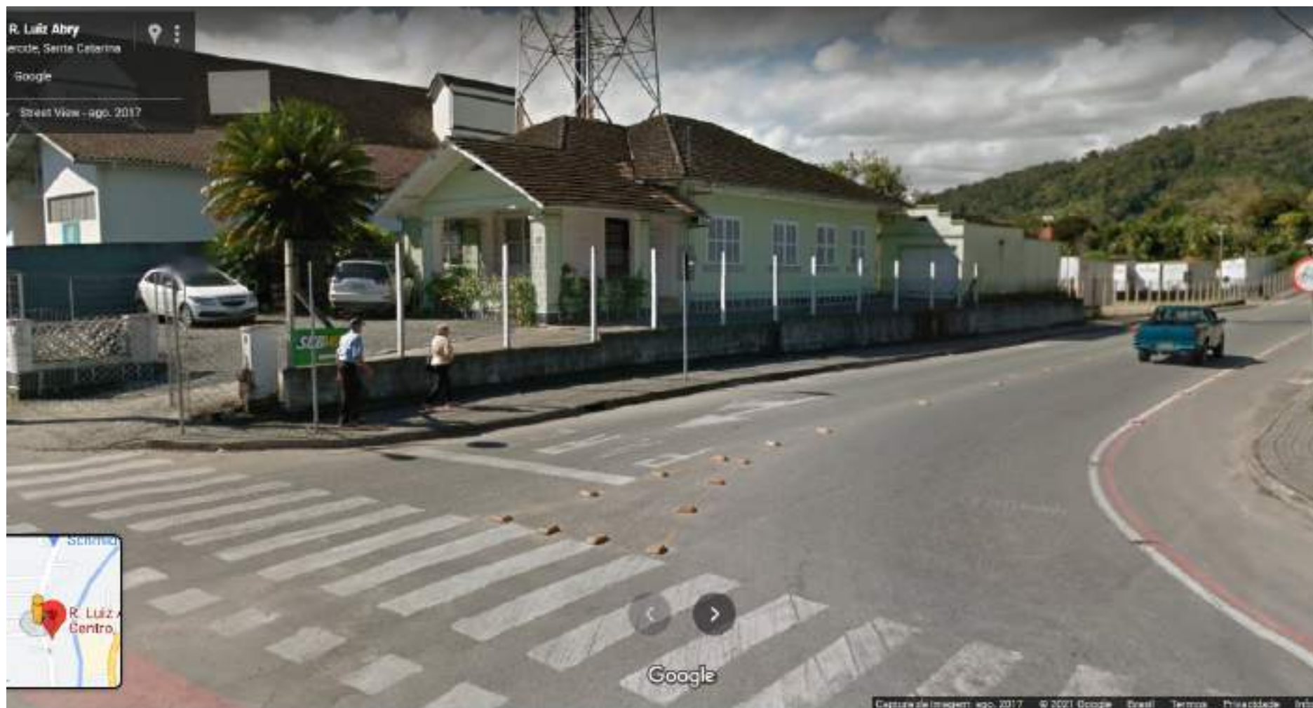
RUA LUIZ ABRY, 522, CENTRO, POMERODE – SC