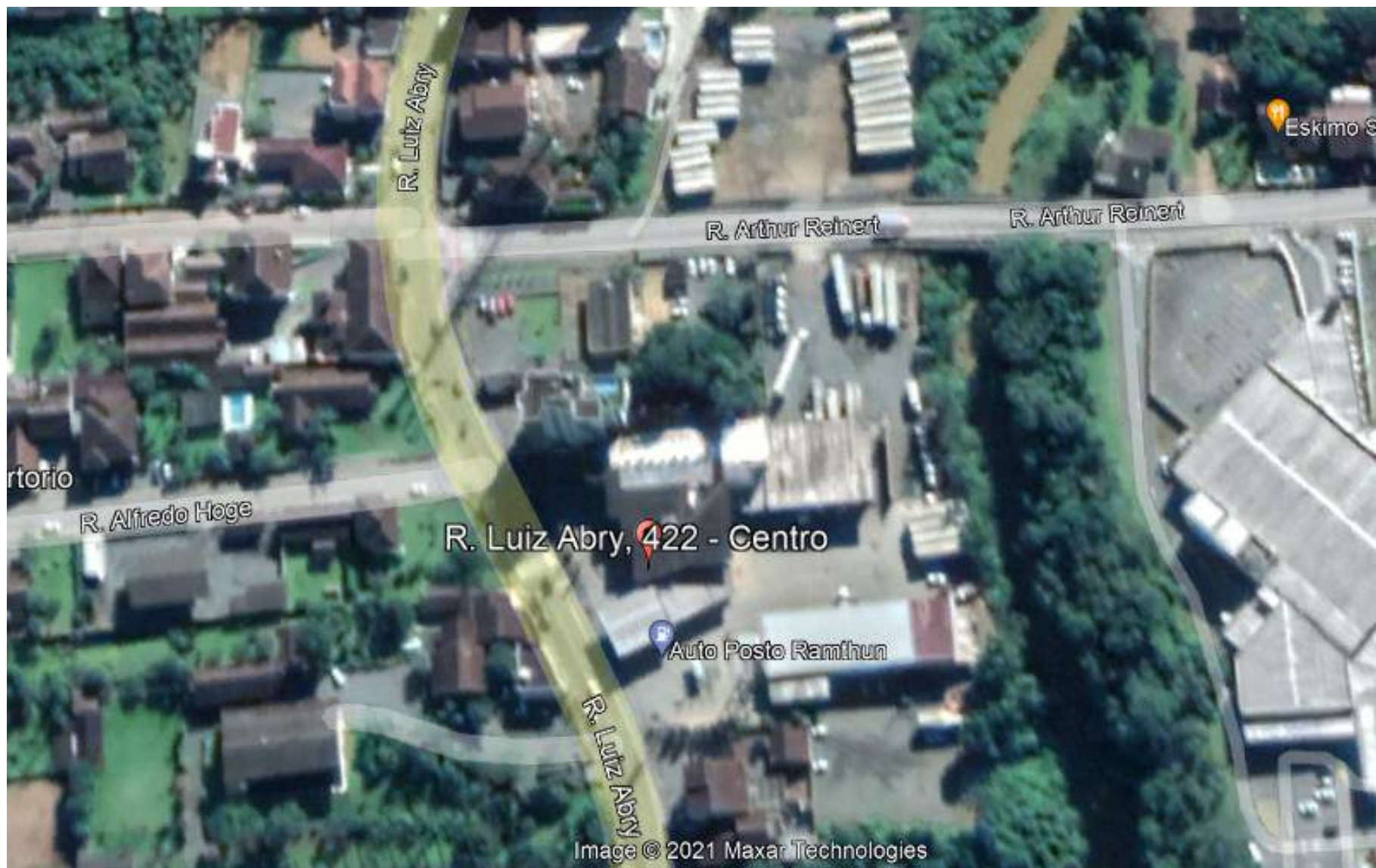
RUA LUIZ ABRY, 422, CENTRO, POMERODE – SC