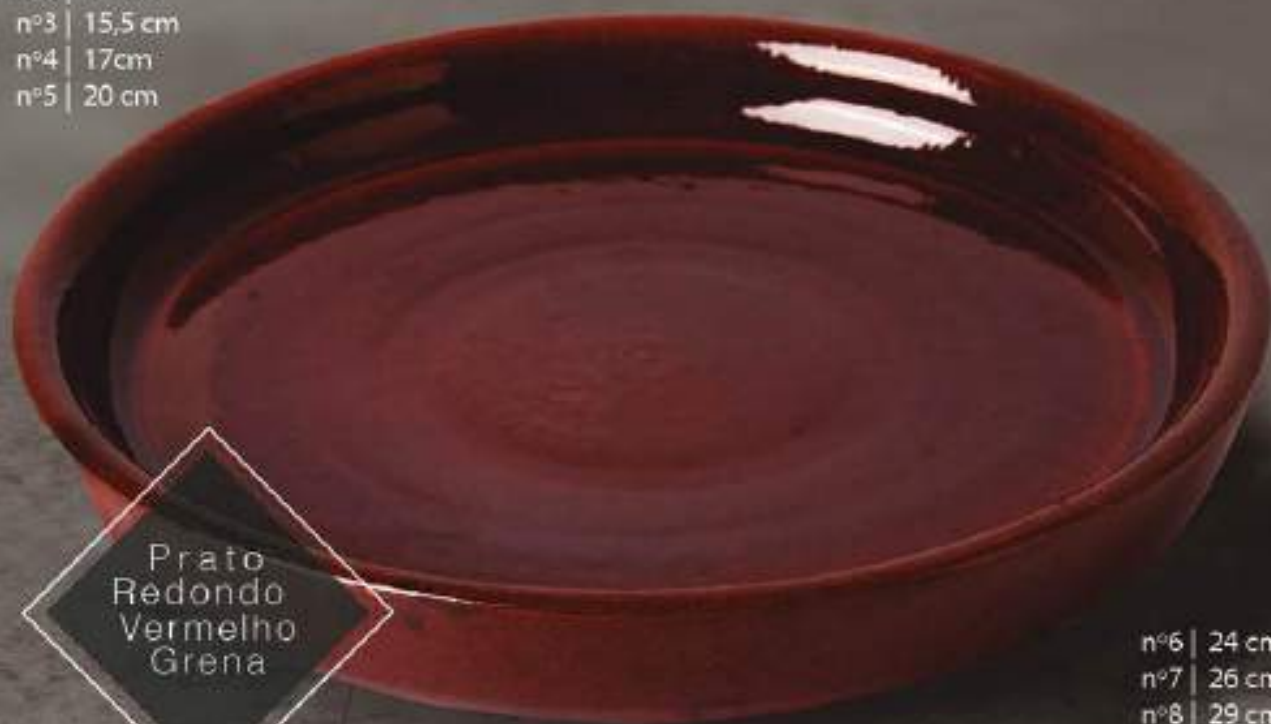
Prato Redondo Vermelho Grena