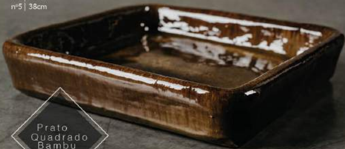
Prato Quadrado Bambu