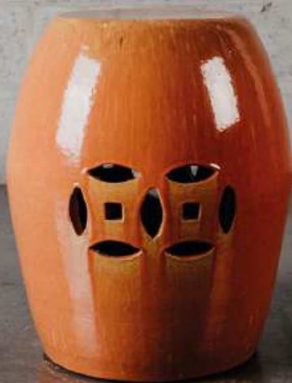
nº1 | 45cm x 28cm