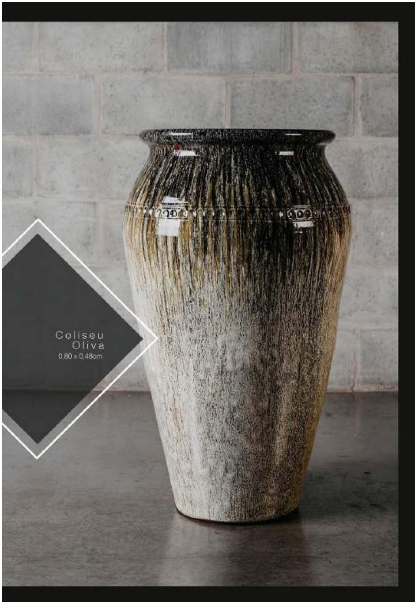
Coliseu Oliva 0,60 x 0,48cm